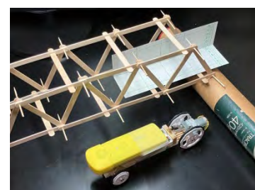
写真) 通路スペースのイメージ 棒をつまよじで繋いだ橋(カテゴリー2の例) 通路サイズ目安のため工作用紙を置いています