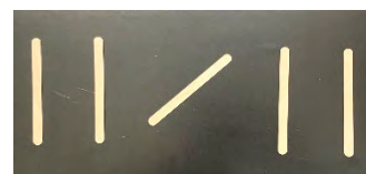
写真) 木製スティック

制作時間は 3時間 を予定しています。あらかじめ、アイス棒に切り欠き等の加工をしておくことは構いません。